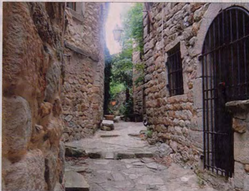
Les vieilles ruelles conduisant au centre d'art actuel résonneront de théâtre et de musique du 21 au 25 juillet avec le concours de l'Art en scène d'Avignon et la municipalité de Banne

Le prix des places est de 10€ pour chaque spectacle. Renseignements et réservations au point info de Banne : 04 75 39 87 18.